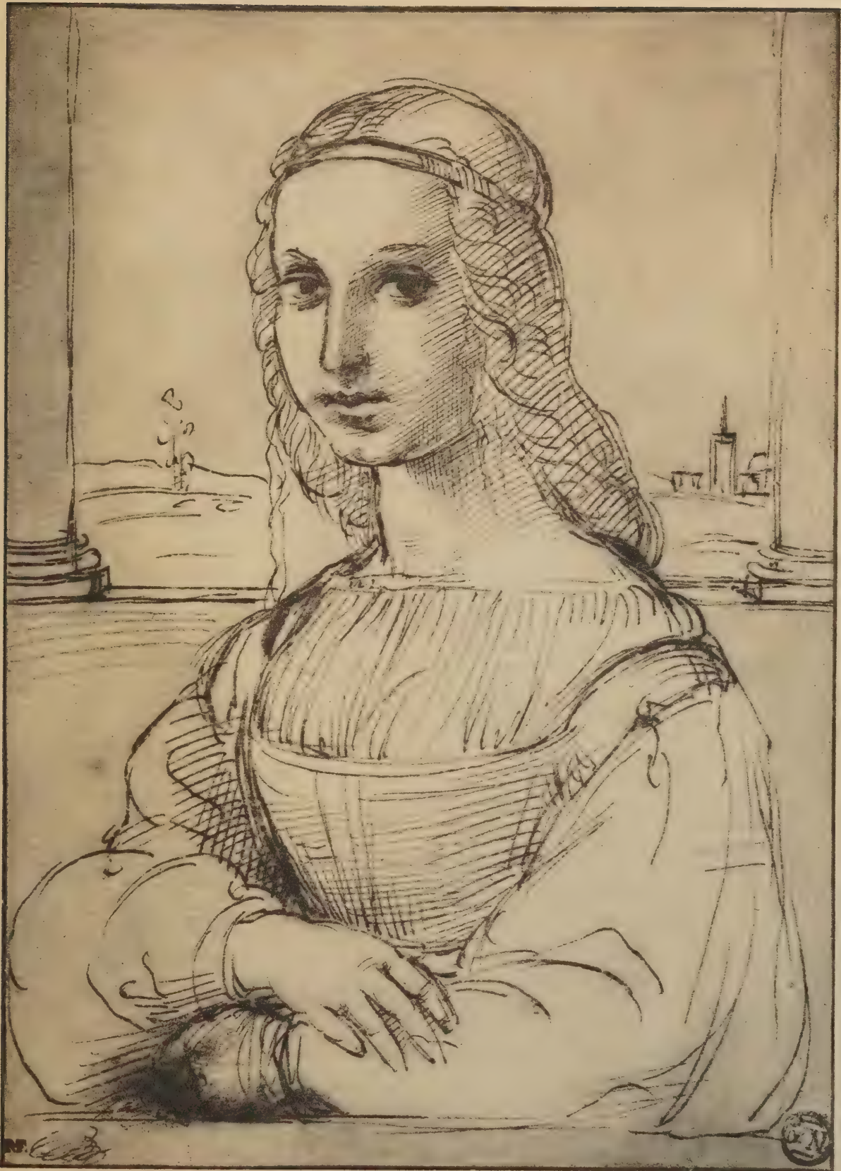
Dessin pour le portrait de Maddalena Doni